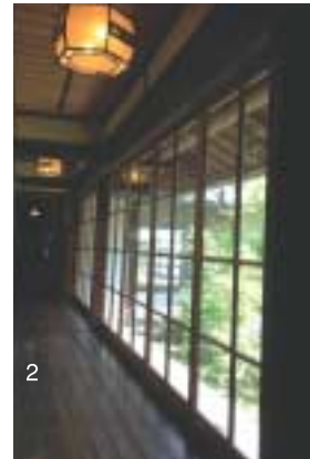
1.小ぢんまりとした庭も粋なしつらえ 2.エントランスの旧館は江戸時代の築。しつ どりした大人のムードが漂う 3.信楽焼タ イルの贅沢空間が広がる内湯