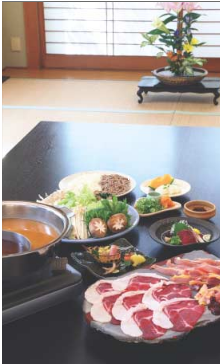
秋冬シーズンはばたと雉の二色鍋をおすすめ(二人分)

泉質 ナトリウム炭酸水素塩泉 効能 神経痛、筋肉痛、関節痛、五十肩、 運動麻痺、うちみ、くじき、冷え性、 痛風、動脈硬化、高血圧症、慢 性胆のう炎、胆石症、慢性 皮膚病、慢性婦人病 ほか