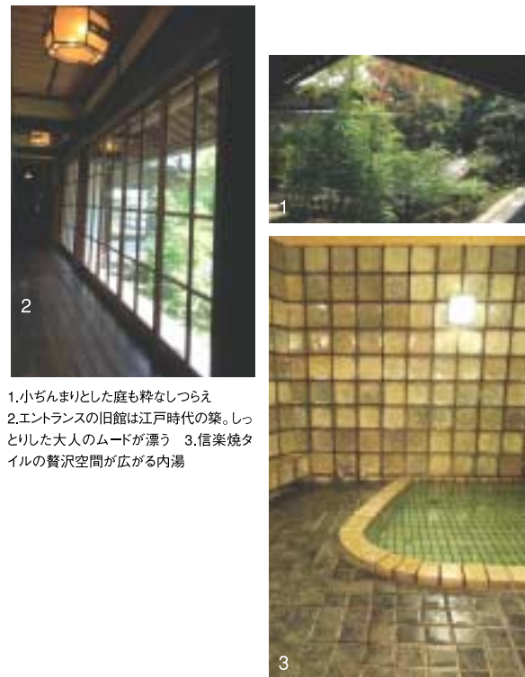
1.小ぢんまりとした庭も粋なしつらえ 2.エントランスの旧館は江戸時代の築。しつ どりした大人のムードが漂う 3.信楽焼タ イルの贅沢空間が広がる内湯

信楽と言えは「たぬき」。里山の風を感じながらたぬきの露天風呂を楽しめるのが「信楽たぬき温泉小川亭」だ。「分福茶釜」「狸の腹鼓」とそれぞれ銘打たれた貸し切り露天風呂は、信楽ならではのユニークな造形が人気。空に近いこの貸し切り風呂は完全予約制で、50分間の夢心地を味わえる。ナトリウム炭酸水素塩泉のお湯は保温性が抜群で、体のなからポカポカに。二方、登り窯で焼成した信楽焼のタイルを大胆に用いた贅沢空間が魅力の内湯は、落ち着いた大人の雰囲気を、それぞれの良さを堪能して。