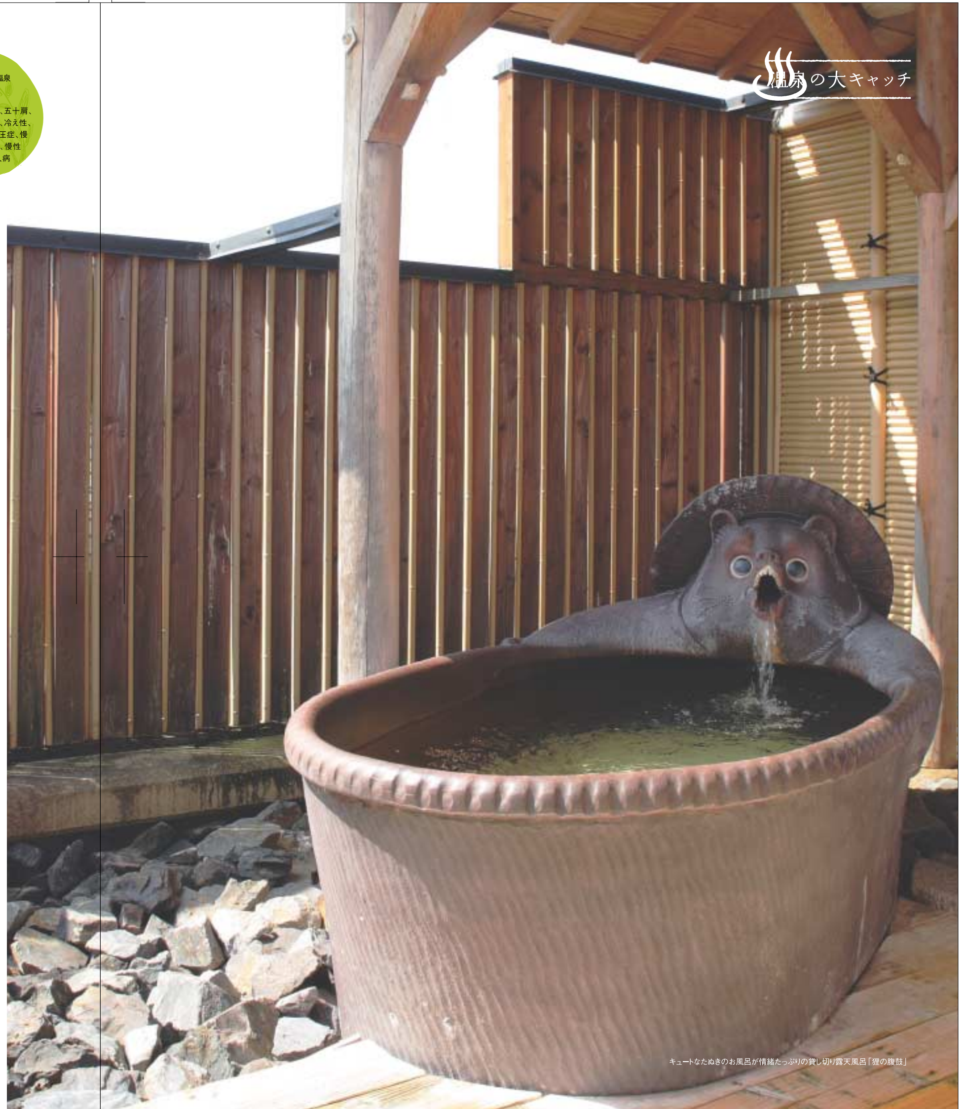
キュートなたぬきのお風呂が情緒たつぷりの貸し切り露天風呂「狸の腹鼓」